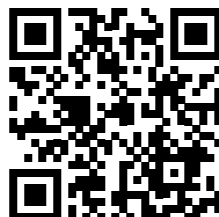
Video Escuela de Música.