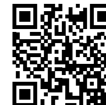
Canal de Youtube, programas y entrevistas de alumnos de la Escuela de Música.