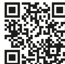
Canción "El Barco", compuesta por ex docentes de la Escuela de Música.