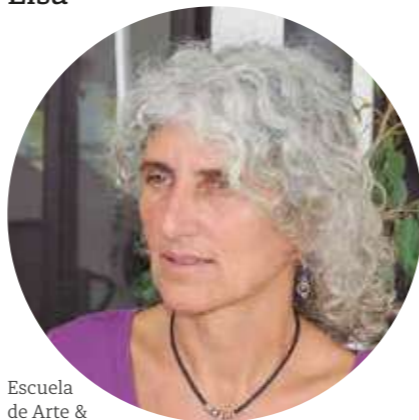
Escuela de Arte & Equipo