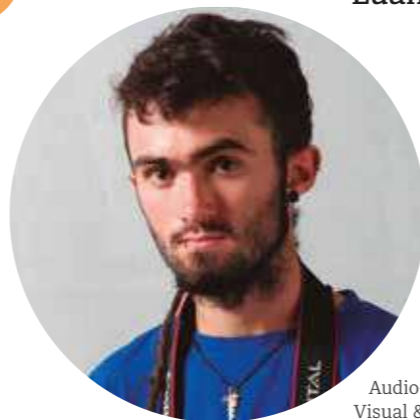
Audio-Visual & Equipo